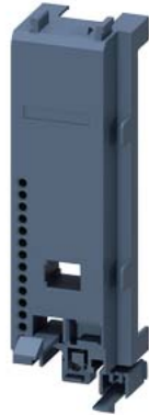
Schützsockel Baugröße S00/S0